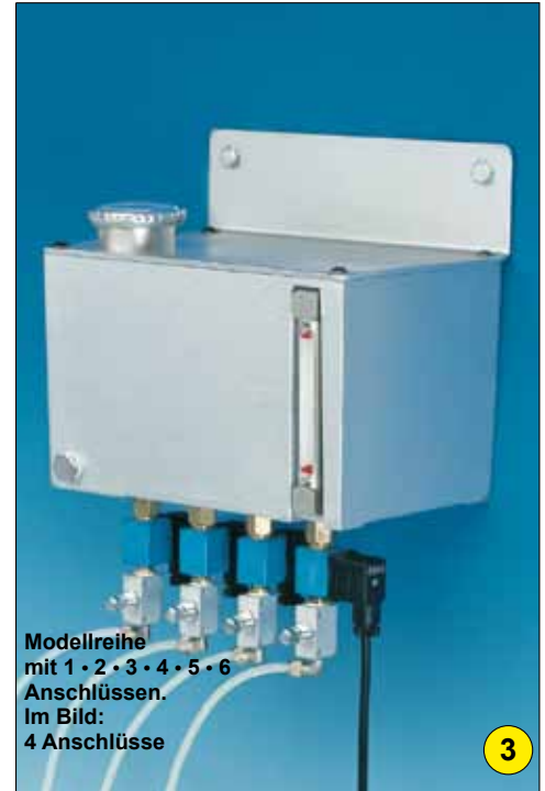
Modellreihe mit 1 · 2 · 3 · 4 · 5 · 6 Anschlüssen. Im Bild: 4 Anschlüsse