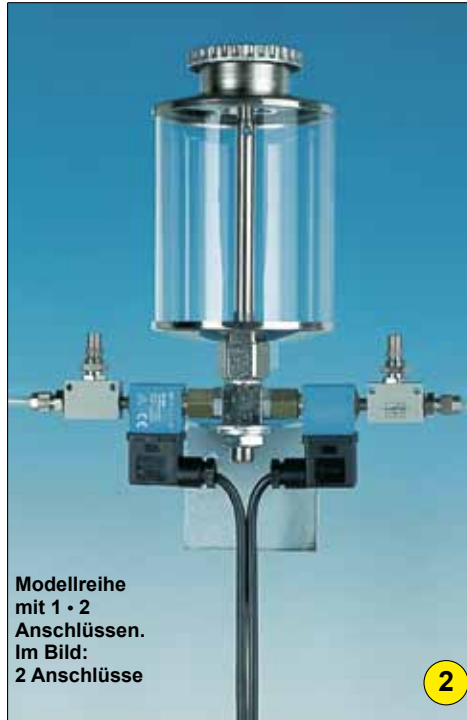
Modellreihe mit 1 · 2 Anschlüssen. Im Bild: 2 Anschlüsse