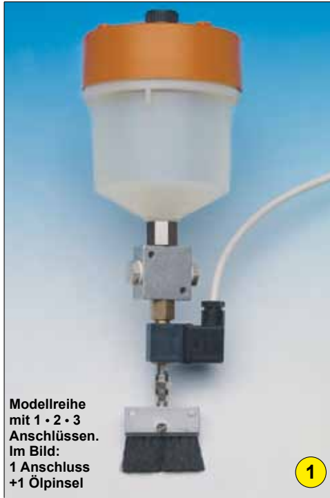
Modellreihe mit 1 · 2 · 3 Anschlüssen. Im Bild: 1 Anschluss +1 Öpinsel